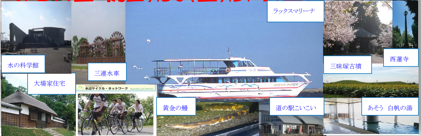
ラックスマリーナ